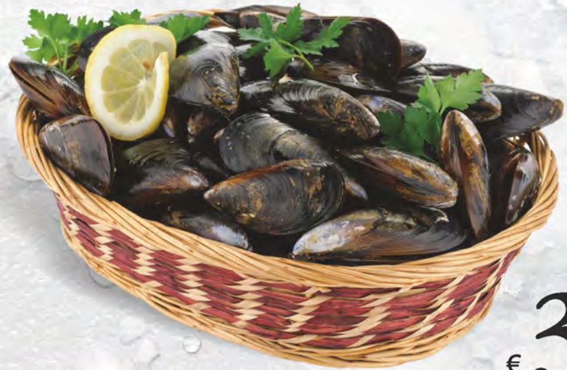
COZZE al kg