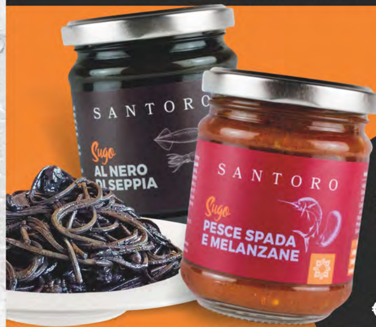
Santoro Sugo nero di seppia/pesce spada e melanzane 180 g

Ricette ispirate alla tradizione e ingredienti selezionati per piatti facili e veloci.