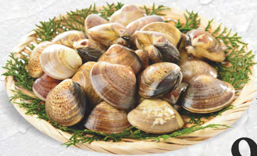
VONGOLE LUPINI al kg