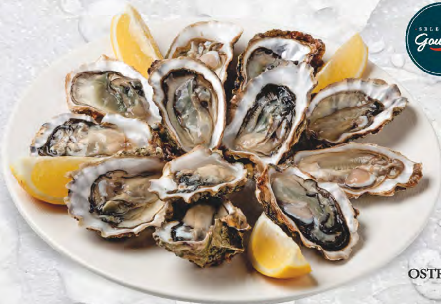
OSTRICHE al kg