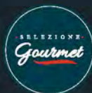
Quattro Portoni Blu di Bufala al kg