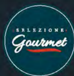
Formaggio Tuma Persa al kg