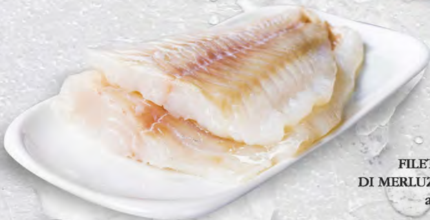
FILETTO DI MERLUZZO al kg