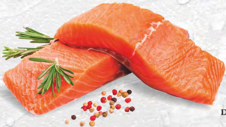
FILETTO DI SALMONE al kg