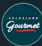
Gruyère svizzero spicchio al kg