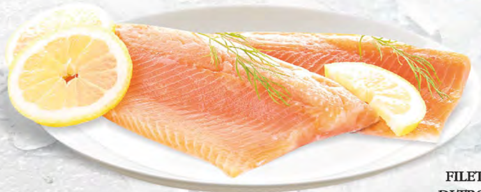
FILETTO DI TROTA al kg