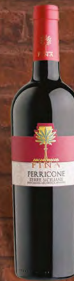
Cantine Fina Ferricone 75 cl