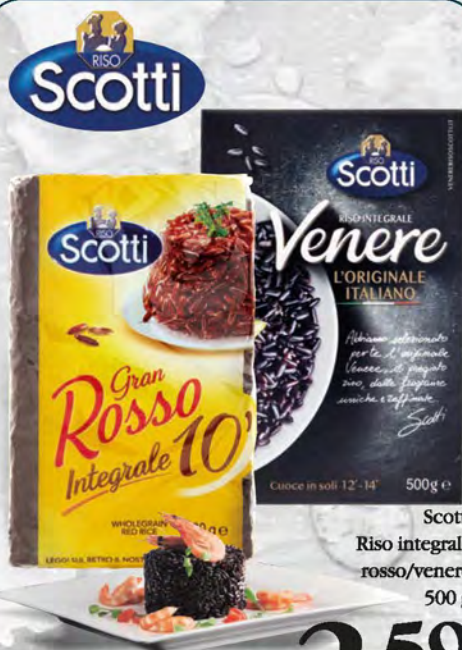
Scotti Riso integrale rosso/venere 500 g