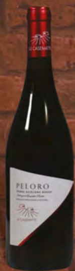
Le Casematte Peloro rosso 75 cl