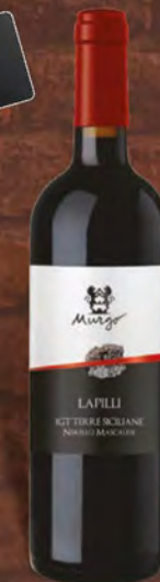
Murgò Lapilli nerello mascalese 75 cl