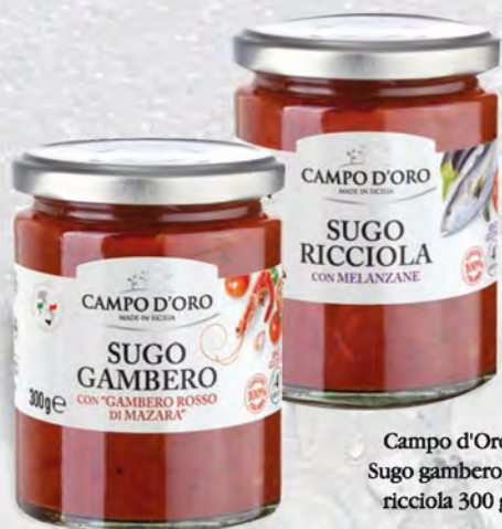
Campo d'Oro Sugo gambero/ ricciola 300 g