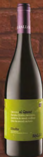
Cantine Rallo La clarissa syrah bio 75 cl