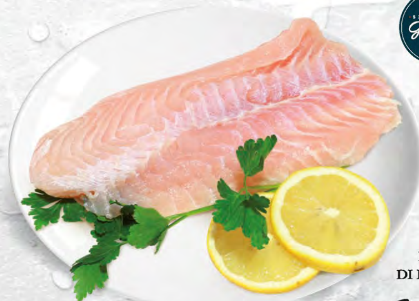
FILETTO DI PERSICO al kg