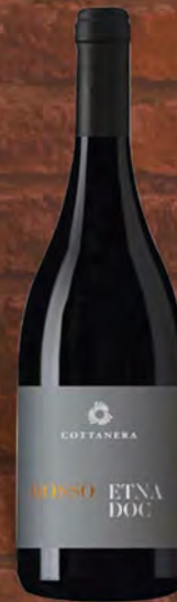
Cottanera Etna rosso D.O.C. 75 cl