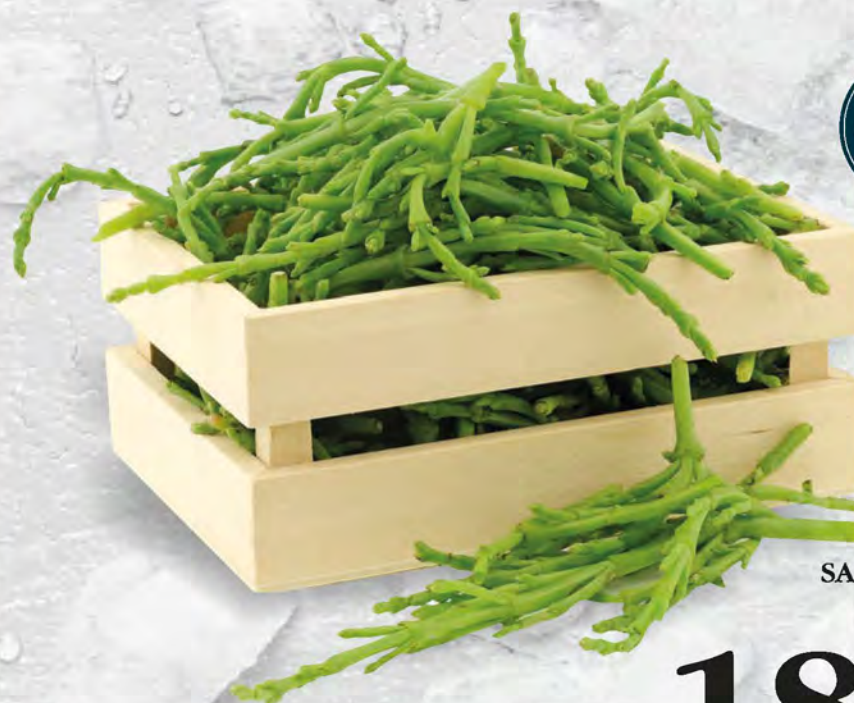
SALICORNIA al kg