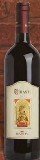
Castello Banfi Chianti D.O.C.G. 75 cl