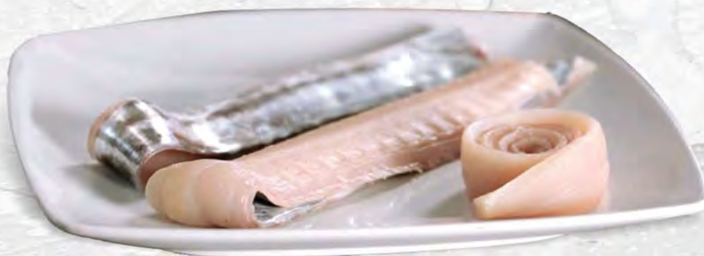
FILETTO DI SPATOLA al kg