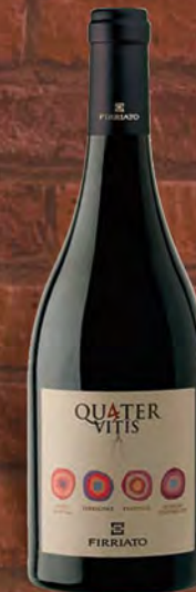
Firriato Quater Nero d'Avola I.G.T. 75 cl