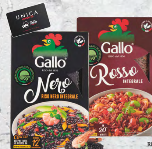
Gallo Riso integrale nero/rosso 500 g