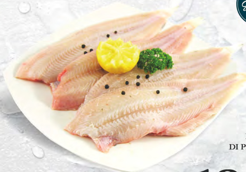
FILETTO DI PLATESSA al kg