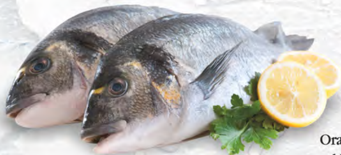
Orate al kg