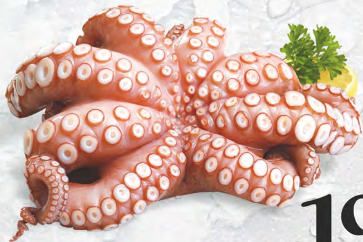
Polpo Fresco al kg