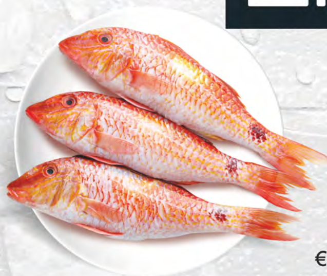
Triglia Rossa I al kg