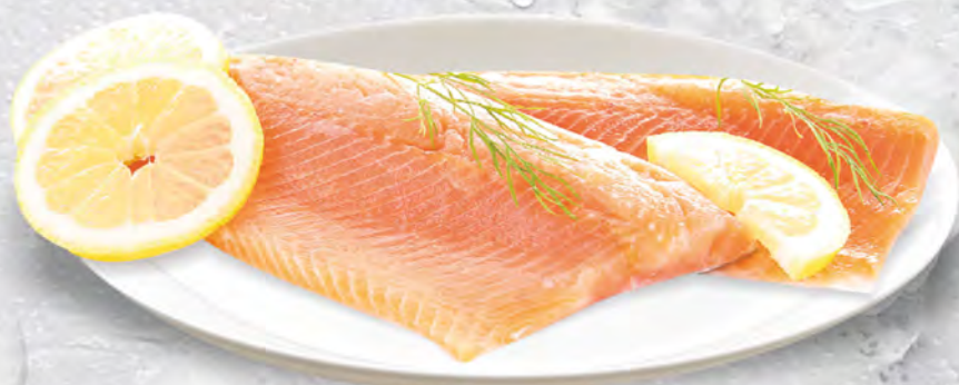
FILETTO DI TROTA al kg