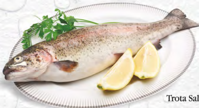
Trota Salmonata al kg