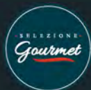
Bresaola di tacchino al kg