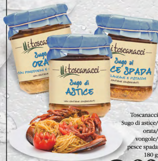
Toscanacci Sugo di astice/ orata/ vongole/ pesce spada 180 g