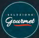
Caputo Culatta casereccia al kg