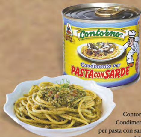
Contorno Condimento per pasta con sarde 240 g