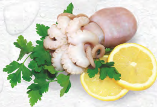
Moscardini al kg