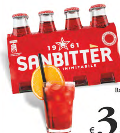
Sanbitter Rosso/bianco 8x10 cl

PREZZO FIDELITY VALIDO SOLO PER I POSSESSORI DI FIDELITY CARD UNICA DECÒ € 2.49 ♦ € 2,49 al lt