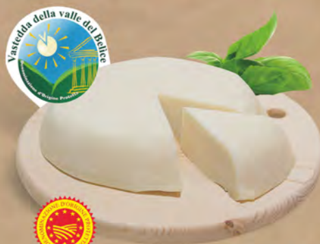
Vastedda Belice D.O.P. al kg