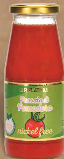
Platinum Passata di pomodoro nickel free 420 g