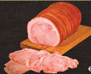
Terre Ducali Porchetta arrosto al kg