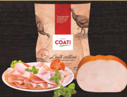
Coati Petto di Tacchino Nazionale al kg