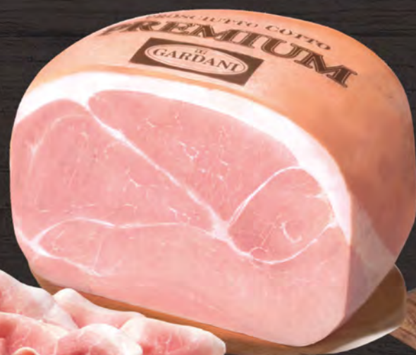
GARDANI Prosciutto cotto nazionale al kg