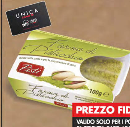
Pistina Farina di pistacchi 100 g

PREZZO FIDELITY VALIDO SOLO PER I POSSESSORI DI FIDELITY CARD UNICA DECÒ € 5,49 ◆ € 27,45 al kg