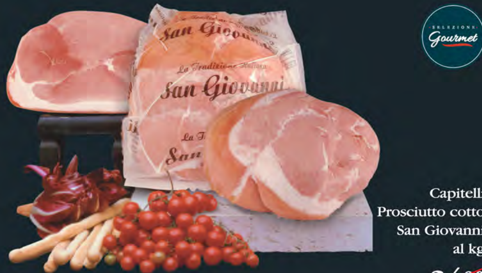
Capitelli Prosciutto cotto San Giovanni al kg