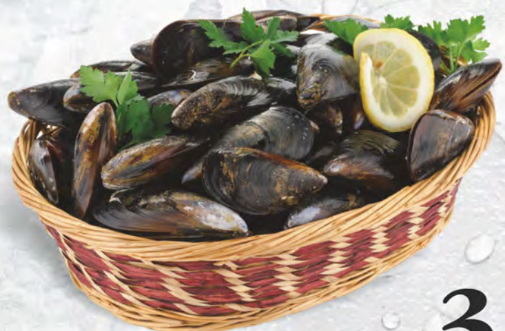
Cozze al kg