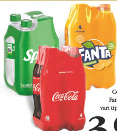
Coca-Cola/ Fanta/Sprite vari tipi 4x45 cl