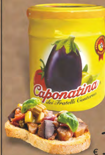
ELI Contorno Caponatina vaso 200 g