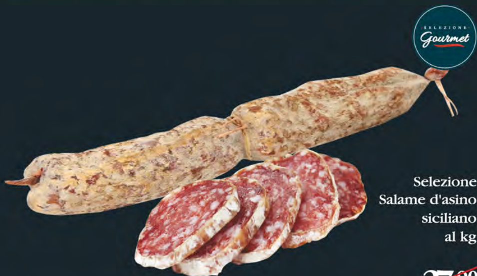
Selezione Salame d'asino siciliano al kg