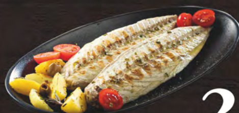
Medusa Filetti di sgombro grigliati al kg