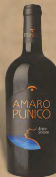
Punico Amaro 70 cl