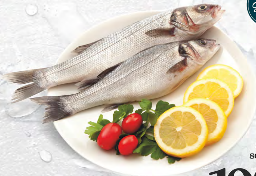
SPIGOLE 800+ al kg