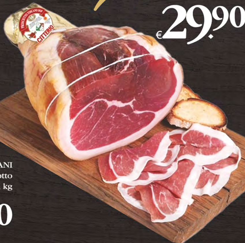
Prosciutto crudo toscano D.O.P. al kg