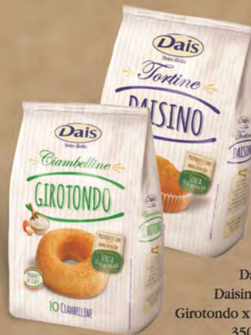
Dais Daisino/ Girottondo x10 350 g

PREZZO FIDELITY VALIDO SOLO PER I POSSESSORI DI FIDELITY CARD UNICA DECÒ € 2,69