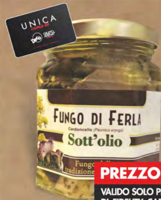
Fungo di ferla sott'olio 200 g

PREZZO FIDELITY VALIDO SOLO PER I POSSESSORI DI FIDELITY CARD UNICA DECÒ € 5,49 ◆ € 27,45 al kg