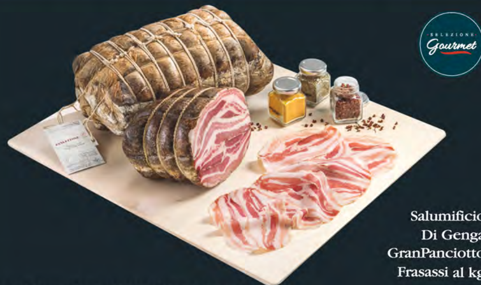
Salumificio Di Genga GranPanciotto Frasassi al kg