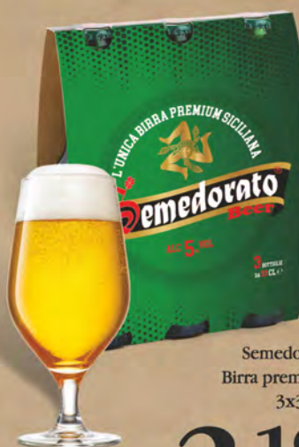
Semedorato Birra premium 3x33 cl