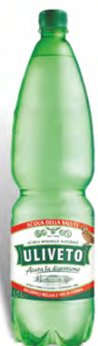
Oliveto Acqua effervescente naturale 1,5 lt