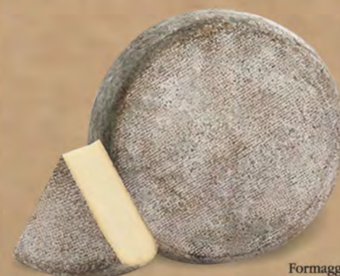
Formaggio Fiore Sicano al kg