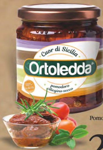
Ortoledda Pomodoro Ciliegino secco 280 g