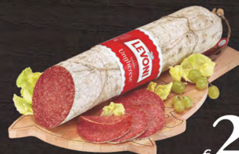
Levoni Salame Ungherese al kg