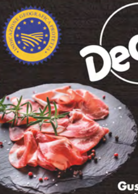
Gusto Decò Coppia di Parma I.G.P. al kg