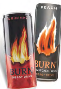
Burn Bibita classica/ pesca zero 25 cl