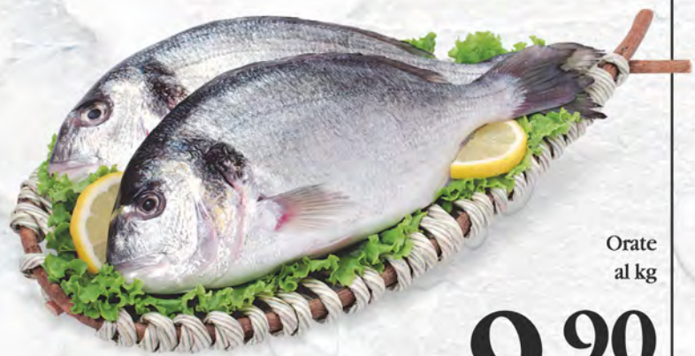
Orate al kg