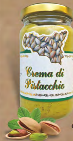
Valle Dell'etna Crema di pistacchio 200 g