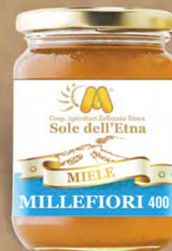
Sole Dell'Etna Miele millefiori 400 g