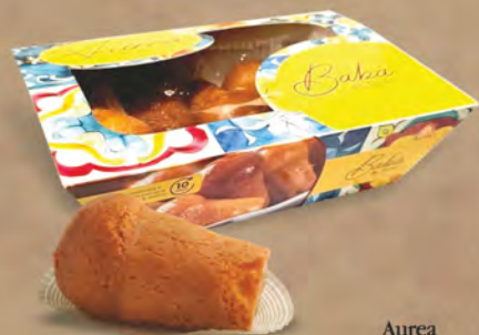
Aurea Babà al Rum mignon 400 g

PREZZO FIDELITY VALIDO SOLO PER I POSSESSORI DI FIDELITY CARD UNICA DECÒ € 3,59 ◆ € 35,90 al kg