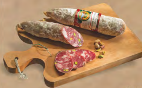
Caputo Salame con pistacchio al kg