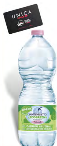
San Benedetto Acqua Easy ecogreen 1 lt

PREZZO FIDELITY VALIDO SOLO PER I POSSESSORI DI FIDELITY CARD UNICA DECÒ € 0,29