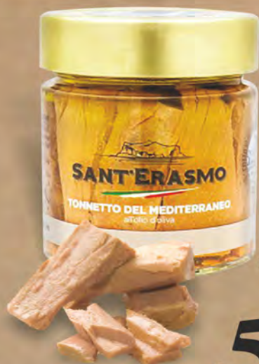
Sant'Erasmo Filetto di Tonno Mediterraneo 200 g