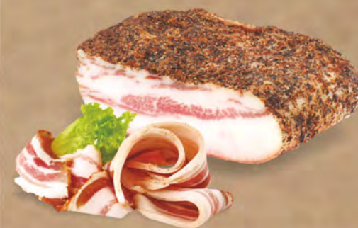
Guanciale di Suino Nero Siciliano al kg