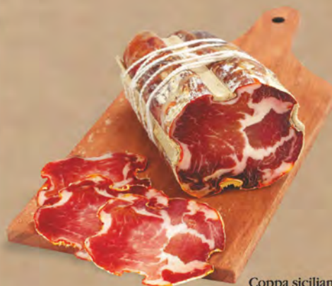
Coppa siciliana piccante al kg