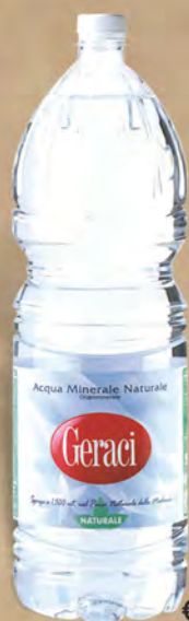
Geraci Acqua naturale 2 lt