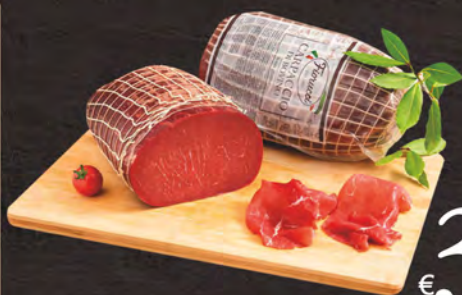
Fiorucci Carpaccio di bovino al kg