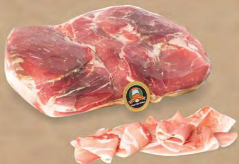
Mulinello Prosciutto crudo Siciliano al kg