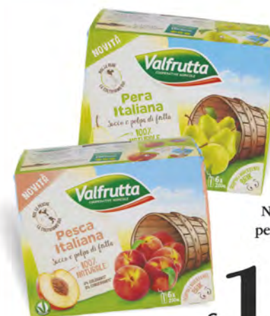
Valfrutta Nettari pesca/ pera/succo ace 6x200 ml