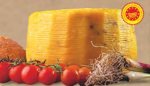
Piacentinu Ennese D.O.P. al kg