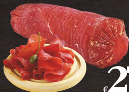
Bresaola di tacchino al kg