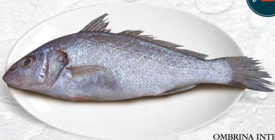
OMBRINA INTERA al kg