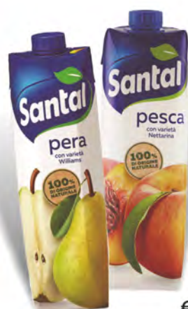
Santal Succhi di frutta vari tipi 1 lt

PREZZO FIDELITY VALIDO SOLO PER I POSSESSORI DI FIDELITY CARD UNICA DECÒ € 0,29