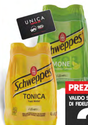
Schweppes Tonica/limone pet 4x25 cl

PREZZO FIDELITY VALIDO SOLO PER I POSSESSORI DI FIDELITY CARD UNICA DECÒ € 2.49 ♦ € 2,49 al lt