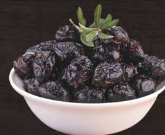
Olive nere al fiore al kg