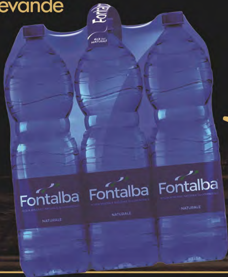
FONTALBA Acqua naturale 6x2 Lt