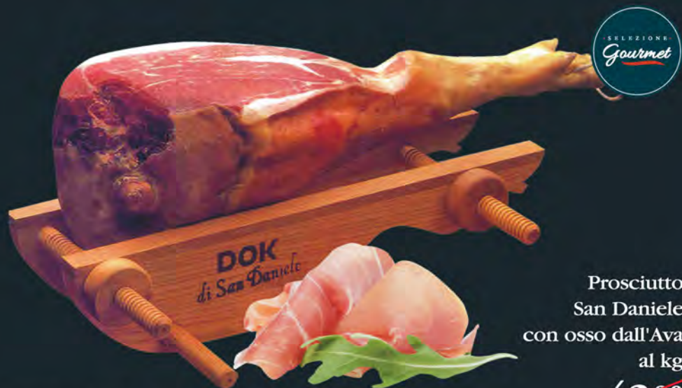
Prosciutto San Daniele con osso dall'Ava al kg