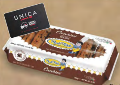
Forti biscotti vari tipi da 550 a 850 g

PREZZO FIDELITY VALIDO SOLO PER I POSSESSORI DI FIDELITY CARD UNICA DECÒ € 2,69