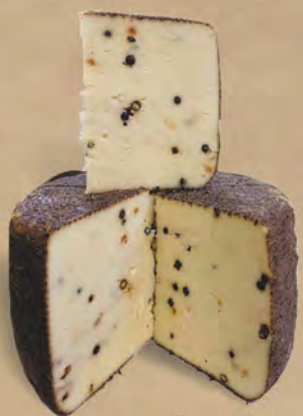
Formaggio terra nera al kg