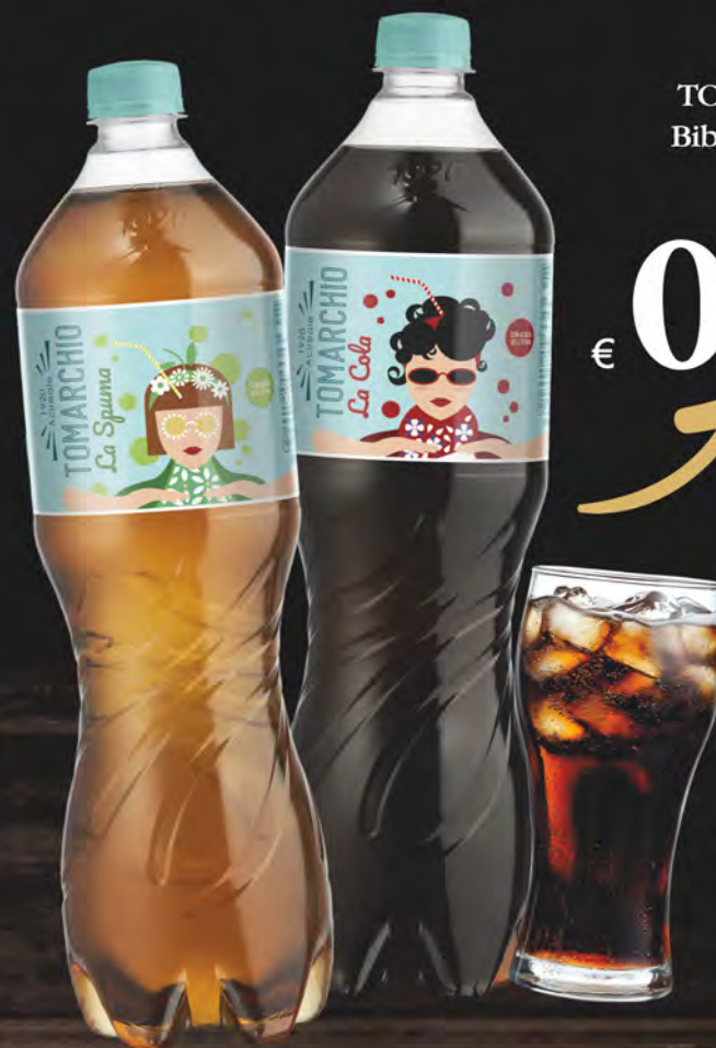
TOMARCHIO Bibite vari tipi 1,25 Lt