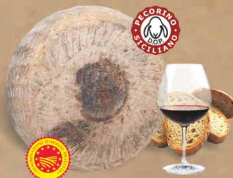
Pecorino Siciliano D.O.P. al kg