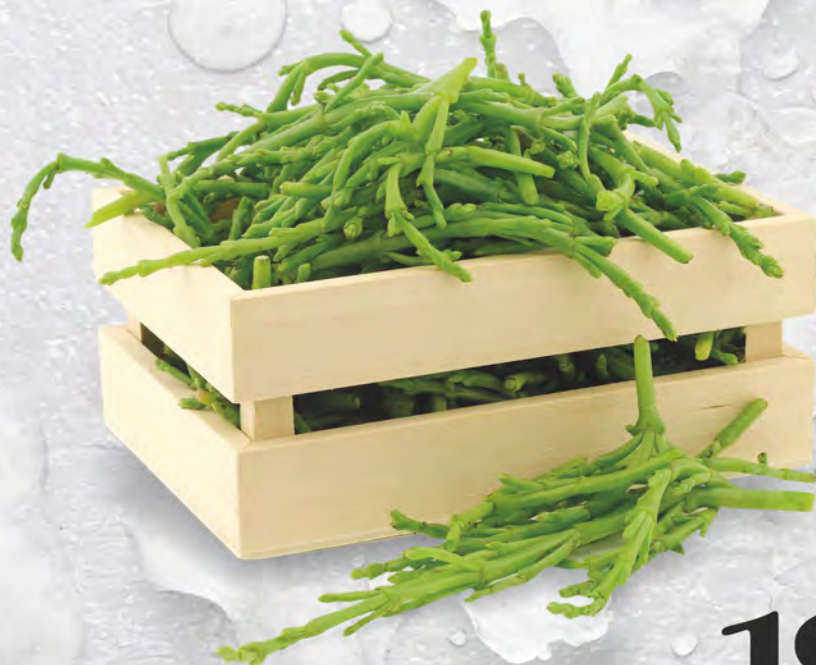
SALICORNIA al kg