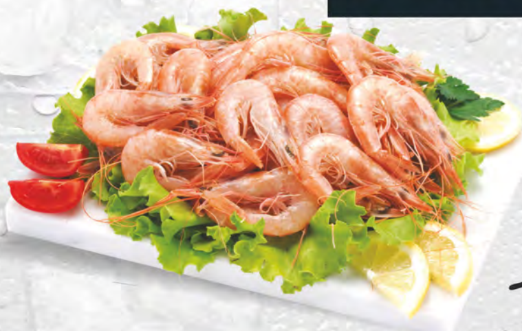
Gambero Rosa al kg