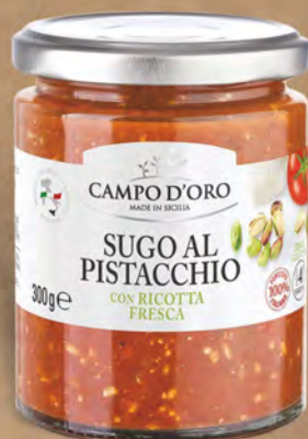
Campo D'oro Sugo al pistacchio 300 g