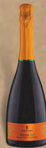
Gorgi Tondi Spumante Brut bio 75 cl